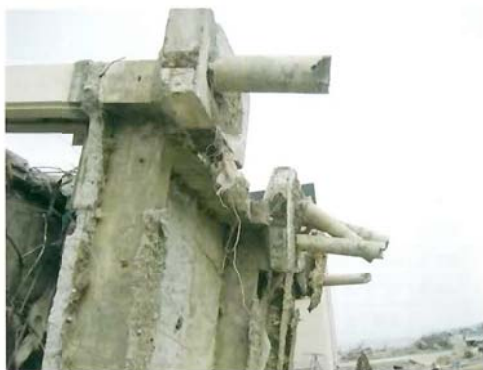
写真-2 前面側基礎の杭5本の状況 (2011.5.20撮影)

今回はそれとは別に東北地方太平洋沖地震いわゆる東日本大震災 (2011) で津波を受けて転倒した RC 造 2 階建ての建物を支持していた PHC 杭 (時代的には PC 杭と言った方が正しいが) A 種を話題にしてみたい。転倒の原因が津波を受けた際に杭が破壊したことにより、従来の地震被害形式とは違って新たな問題を投げかけているからである。文献 1) ではその被害様相 (RC 造 2 階建ての女川交番を支持していた杭の破壊) を写真 2 として示したが、杭頭から約 1.5m の所で一様に破断していることが特徴的である。最初にこの被害を見た時には “今までの被害様相とは何か違うな” といった印象に留まっていたのであるが、次第に “これは引張り破断に近いのか、引張り破断そのものではないか” との考えに至ったのである。